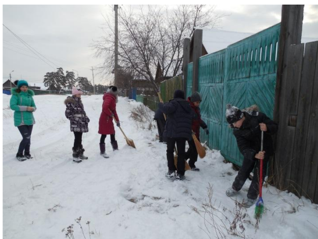
Помощь ветеранам педтруда