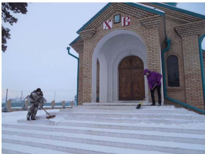
Уборка снега у Храма с. Сосновка