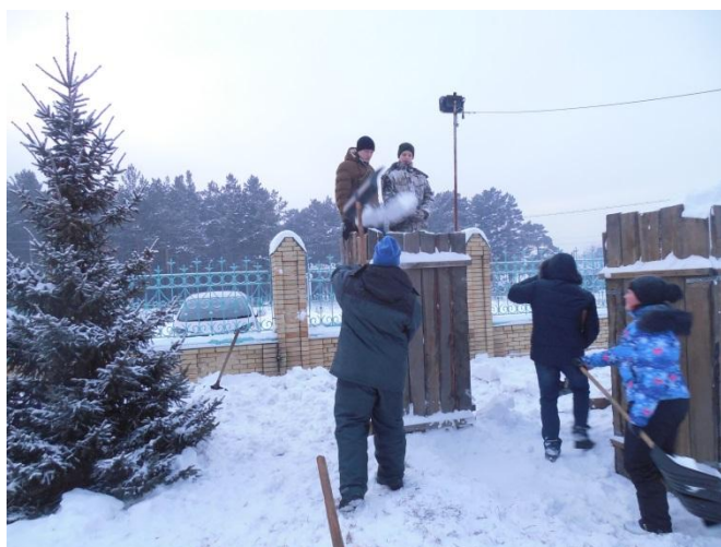
Постройка снежных фигур