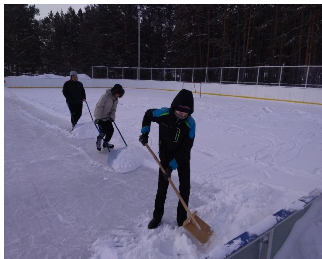
Уборка снега на сельском коте